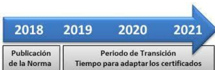
CALENDARIO TRANSICIÓN ISO 45001:2018